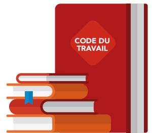
Plus d'informations sur les droits d'alerte et de retrait : voir les articles L. 4131-1 à L. 4131-4 du Code du travail.

NUL NE POURRA VOUS REPROCHER D'AVOIR FAIT VALOIR VOTRE DROIT DE RETRAIT S'IL EST FONDÉ ET PERMET DE PRÉVENIR DES CONSÉQUENCES QUI PEUVENT ÊTRE GRAVES POUR VOUS-MÊME, VOS COLLÈGUES OU LES CLIENTS.